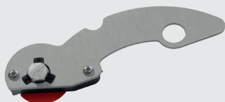
Kit coltello per taglio tessuti con lama circolare