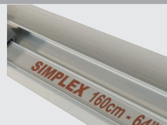
Design realizzato per estrusione per garantire qualità e precisione di taglio