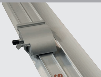
Comoda impugnatura del gruppo portalama scorrevole con regolazione della profondità di taglio