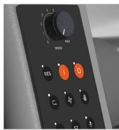
Velocità regolabile elettronicamente