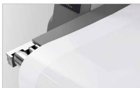
Piano di lavoro in acciaio estraibile per accedere facilmente ai rulli Barra premifoglio anteriore (optional)