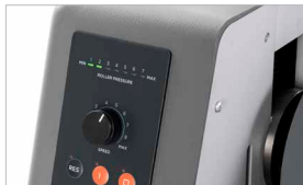
Visualizzatore a LED della pressione dei rulli per evitare la pressione eccessiva