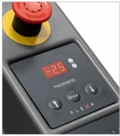
Sollevamento motorizzato del rullo superiore (optional)