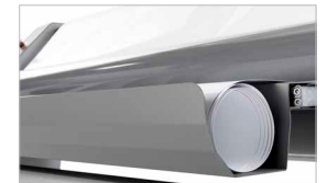
Vasca anteriore di supporto stampe (optional)