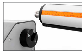
Alberi in alluminio con sistema automatico di aggancio