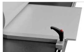
Squadra di riferimento con guida (optional)