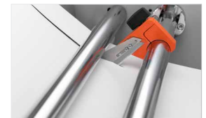
Unità di taglio con due coltelli (optional)